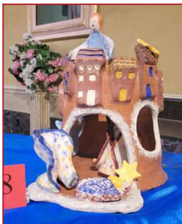
1° Artisti: Lucia Bessone