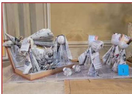
1° Adulti: Elisabetta Rossi