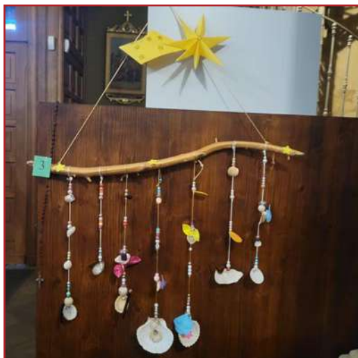
1° Scuole: Primaria di Villanova M.vì