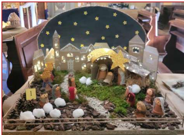
1° Gruppi: Biblioteca Civica di Montaldo